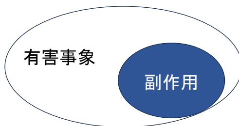
【有害事象と副作用の関係】

*副作用とは、くすりと有害事象との間の因果関係について、少なくとも合理的な可能性があり、因果関係を否定できない反応を指します。有害事象とは、あらゆる好ましくない、または意図しない症状・病気・検査値の異常などのことで、くすりの使用や治験の手順が原因であるものも、そうでないものも含まれます。