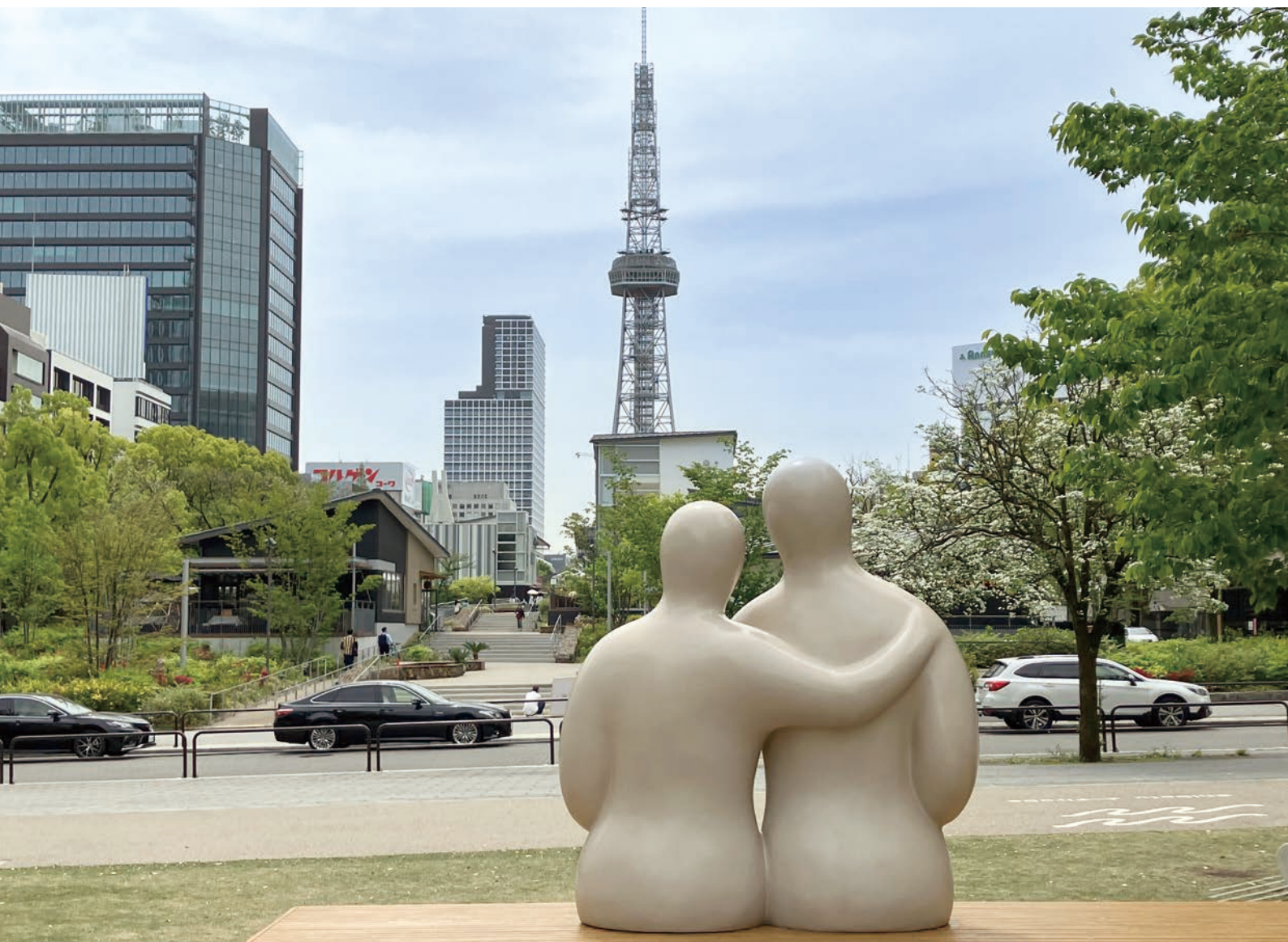
MIRAI TOWER(Hisaya-odori Park/名古屋市中区)