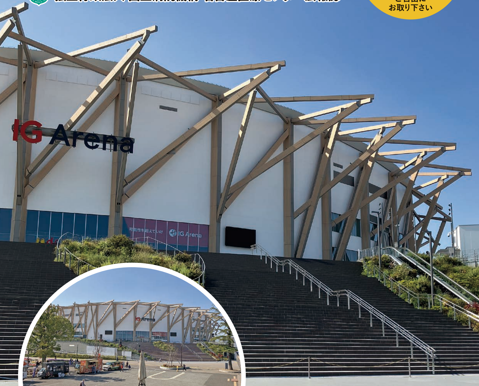
写真：IGアリーナ／名古屋市北区(地下鉄名城公園駅下車)