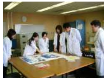
週一回の抄読会の風景

2014 年 8 月現在、常勤医師 3 名、後期研修医 4 名で診療にあたっています。内分泌学会、糖尿病学会、甲状腺学会それぞれ専門医・指導医が在籍しており、いつでも質問しやすい環境にあり、適切な指導を受けることができます。