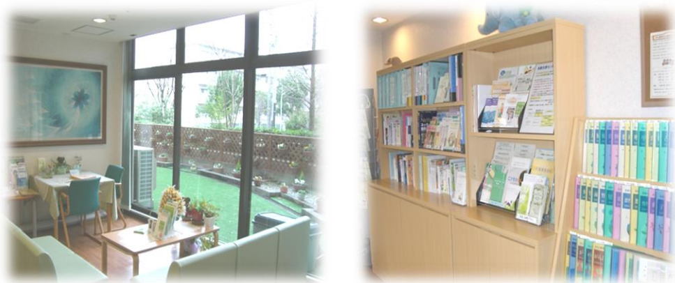
やすらぎサロンの様子