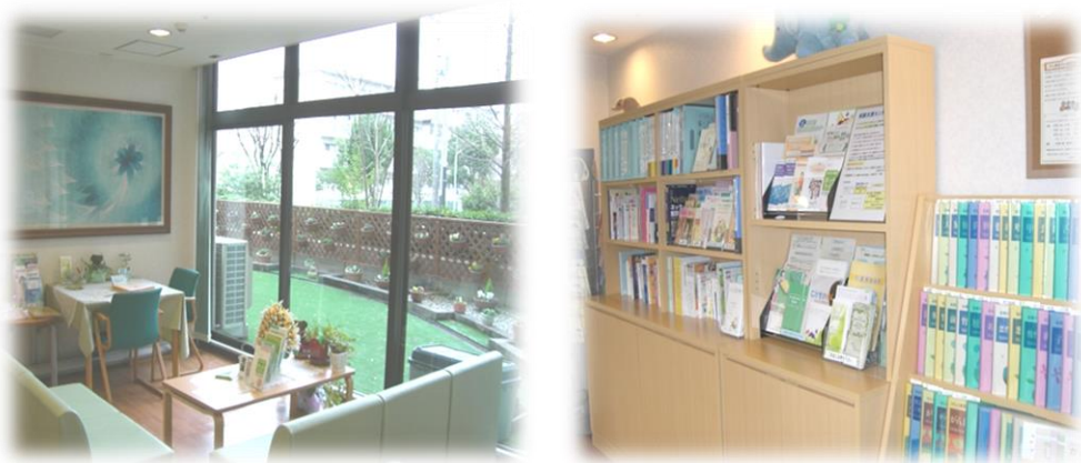
やすらぎサロンの様子