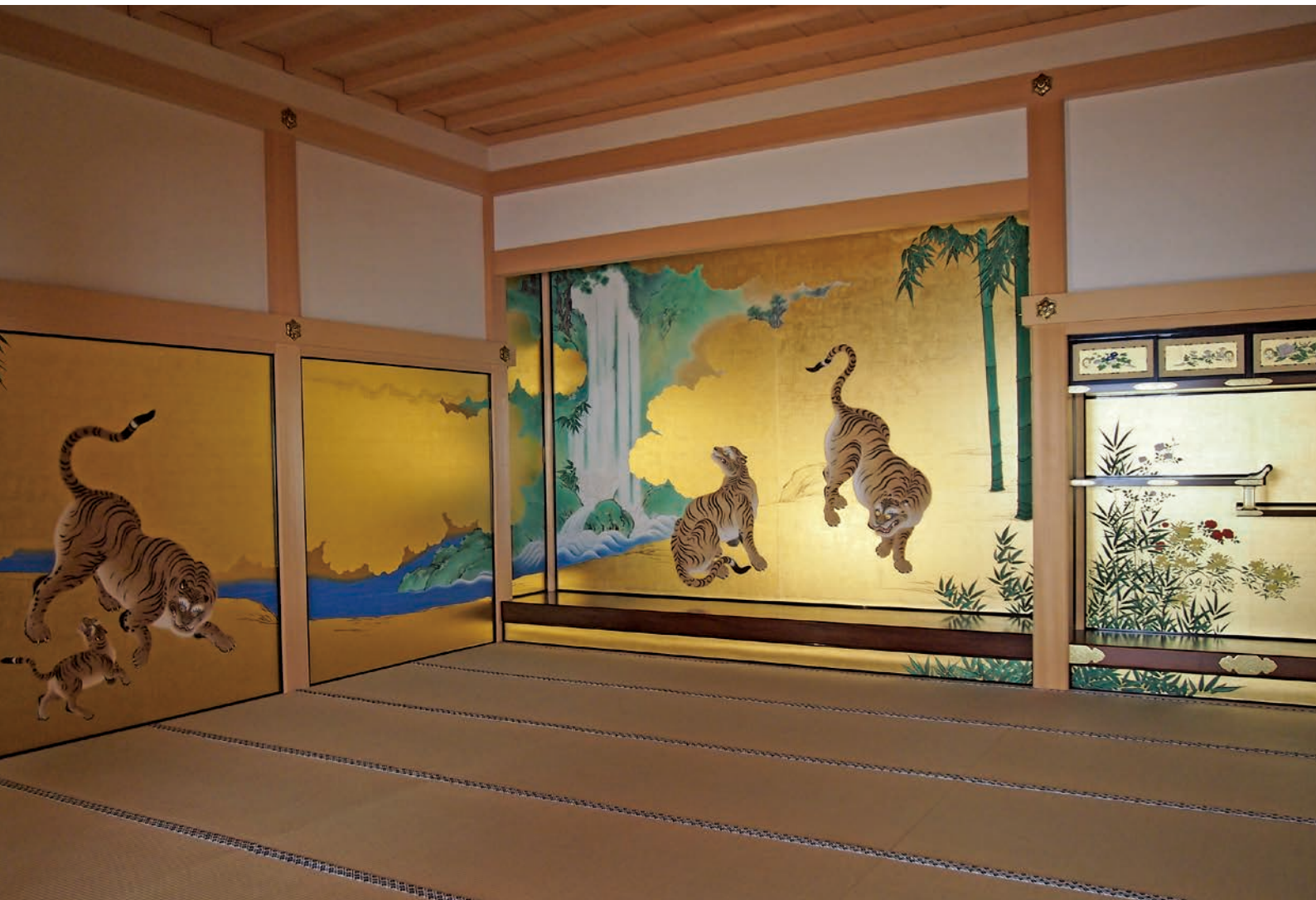
写真:名古屋城本丸御殿 玄関一之間「竹林豹虎図(復元)」