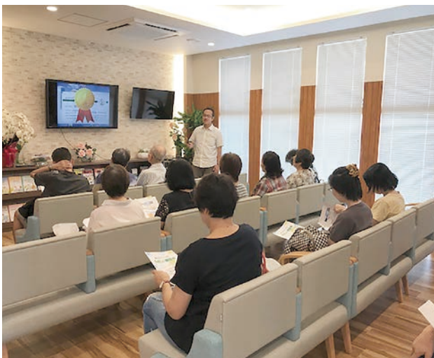
『やさしい講話会』の様子

泌尿器疾患を代表する前立腺肥大・過活動膀胱・尿路結石の診断治療をはじめ、各種日帰り手術を行っています。また、泌尿器がん(前立腺がん・膀胱がんなど)の早期発見にも力を入れております。特に勤務医時代より研究をしてきました前立腺がんに関しては、PSA検査やMRI検査を積極的に行い、異常を認める患者さまには日帰りで前立腺組織検査を施行しております。悪性を認めた場合は、治療